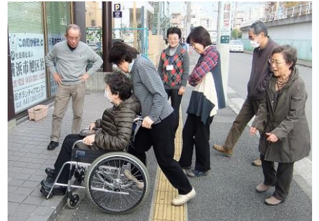
(車いすの段差操作実習)

合わせて35人でした。とくに3人に1台分用意した車椅子の屋外実習が好評でした。この講座の発展として、「緊急時の対応と応急措置講座」の要望が強く、29年度は両講座を実施する予定です。