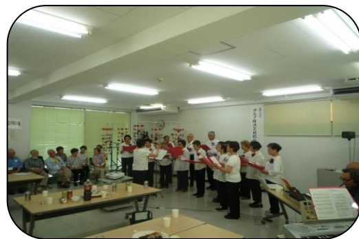
「ららの会」のコーラス

会場の机、椅子を元に戻し、展示品の撤去などをみんなで行ない16時30分に無事終了した。